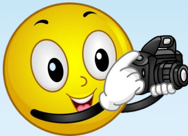
Фото з нею ви зробіть Файл швиденько прикріпіть!